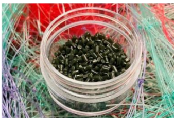
廃棄されるエアバッグや漁網